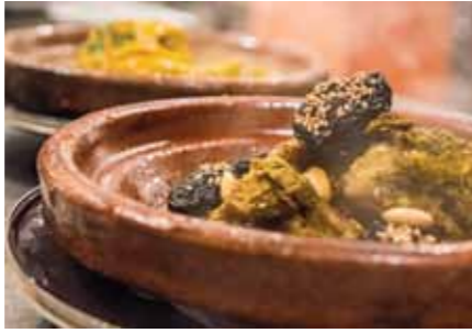
Kuzu etli tanjin, tavuklu kuskus, tabule, samussa ve pastilla... Arap, Yahudi, Berberi ve İspanyol etkilerini taşıyan Fas mutfağı, gösterdiği çeşitlilik bakımından Afrika kıtasının en zenginlerinden.