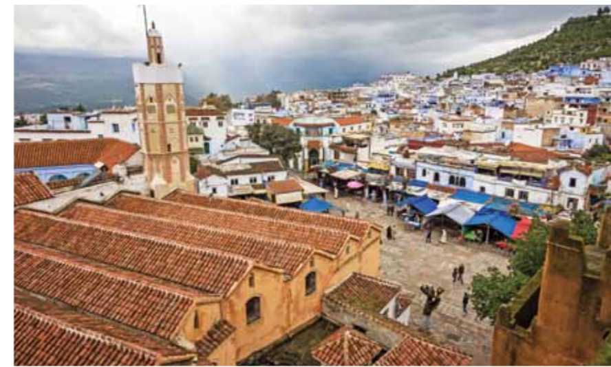
1500'ü yıllarda İspanya'da engizisyon'dan kaçıp Chefchaouen'e yerleşen Yahudiler tüm şehri maviye boyadılar.

bulunabileceği, koşuşturmacalı ve aktif bir ticaret merkezi burası.