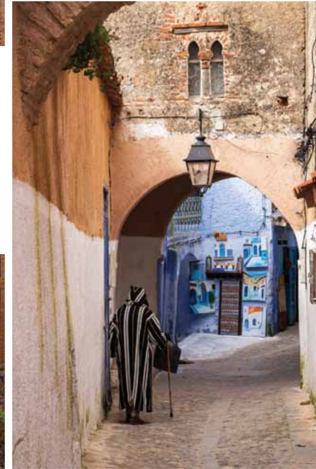
Son zamanlarda artan yabancı ziyaretçi sayısı, Chefchaouen'in sakin ritmini ve geleneksel havasını bozmadı. Sivri kapüşonlu mantolarıyla yaşlılar kemerlerin altından yürüyerek yavaşça evlerine dönerken, dar sokaklarda müezzinin sesi yankılanıyor.