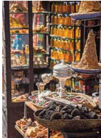
Fas, limitsiz bir renk, kumaş ve doku seçeneği sunuyor. Konu el sanatı olunca dünya çapındaki ününe meydan okumak mümkün değil.