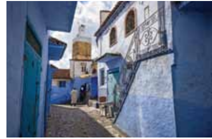
Chefchaouen, mavi renginden dolayı fotoğrafçılar için ideal bir destinasyon. Marakeş ve Fes'e kıyasla çok daha az ziyaret edilmesi onu daha da cazip kılıyor.