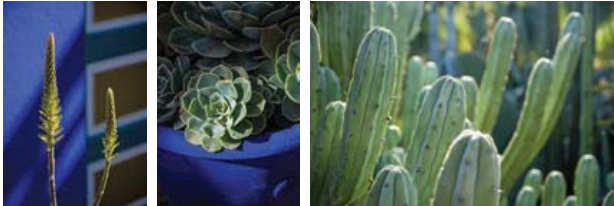
Bahçede, çoğunluğu Saint Laurent ve Berge tarafından Güney Amerika’dan getirtilip bahçeye dikilmiş tam 30 farklı kaktüs çeşidi bulunuyor.

Dönemin yıldız parlayan ressamlarından Jacques Majorelle, 1923’te Marakeş’in sınırındaki bir palmiyeliği satın aldı. Kavak ağaçlarının fazlalığı arazideki suyun da ne kadar bol olduğunu kanıtıyordu. Berektili toprağın