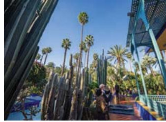
Jardin Majorelle'de mavinin dışında canlı san ve turuncu renkler de dikkat çekiyor.

ince, bodur, etli, topumsu, bir deniz bitkisi şekilli 30 farklı kaktüs türü bahçenin her yerine serpiştirilmişler. Halbuki ne bir kovboy filminin setinde ne de Sahra'nın sıcak ve ıssız