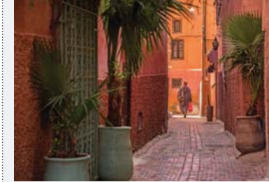
Jemaa El Fna'nın kuzeyinde kalan kapalı çarşılar, Fas'ın el sanatlarına dair her şeyi bulabilirsiniz.