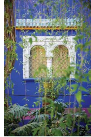
Jacques Majorelle, villasını mavide boyadığında bu rengin ileride ünlü olup ‘majorelle mavis’i adıyla anılacağından habersizdi.

Bahçenin farklı yanlarına dağılımış ve içerlerinden envai bitkinin en parlak, en gösterişli ve en havali halleriyle salıkum saçak süzülüyor vazolar, nilüfer ve Asya lotuslarının narince yüzdüğü havuzun kenarlıkları, sağa sola serpiştirilmiş sandalyeler, çeşmeler ve tabii ki bahçenin gözbebeği ‘villa’. Hepsisi bu özel mavide boyanmış. Hatta Saint Laurent ve Berge’nin çok haklı olarak ‘vaha’ adını verdikleri, Berberi ve Art