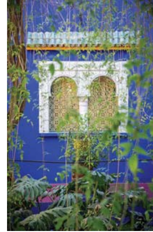
Jacques Majorelle, villasını mavide boyadığında bu rengin ileride ünlü olup ‘majorelle mavis’i adıyla anılacağından habersizdi.