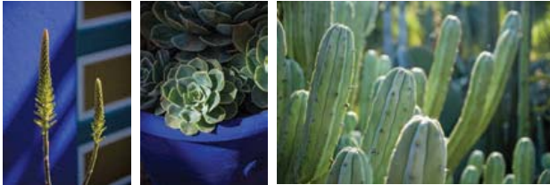
Bahçede, çoğunluğu Saint Laurent ve Berge tarafından Güney Amerika’dan getirtilip bahçeye dikilmiş tam 30 farklı kaktüs çeşidi bulunuyor.

Bahçenin farklı yanlarına dağılımış ve içerlerinden envai bitkinin en parlak, en gösterişli ve en havali halleriyle salıkın saçak süzülüyor vazolar, nilüfer ve Asya lotuslarının narince yüzüğü havuzun kenarlıkları, sağa sola serpiştirilmiş sandalyeler, çeşmeler ve tabii ki bahçenin gözbebeği ‘villa’. Hepsini bu özel mavide boyanmış. Hatta Saint Laurent ve Berge’nin çok haklı olarak ‘vaha’ adını verdikleri, Berberi ve Art