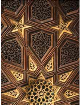
Aydınoğlu Mehmet Bey Camii'nin yıldız figürleriyle bezeli minberi / The stary minbar of Aydınoğlu Mehmet Bey Mosque

kahvehanesinde nar suyu ya da Türk Kahvesi yudumlayarak etrafı seyre dalmak çok keyifli. Aydınoğulları Beyliği zamanından kalma 752 yıllık Aydınoğlu Mehmet Bey Camii, tarihi kahvehanenin hemen karşısında. Caminin güney duvarındaki antik aslan heykeli, turkuaz ve morun en hoş tonlarıyla bezeli mihrabı ve sol ön köşesinde yer alan minaresi, onu farklı kılan özellikleri. Ancak onu asıl özel yapan 'kündekâri' yani 'ağaç geçki sanatı' tekniğiyle