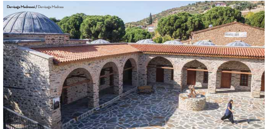
Dervişağa Medresesi / Dervişağa Madrasa

Birgi is located on the southern slopes of Bozdağ (İmolos) which is also nicknamed "The Alps of the Aegean". The mountain, whose summit stands at an altitude of 2159 metres, has been the subject of legends since ancient times. Bozdağ is a popular spot for paragliding fans and also has a ski centre offering winter sports. In other words, when you have had your fill of green in Birgi, you can ascend Mount Bozdağ and surround yourself with white. Having come this far, make sure you don't miss out on seeing Lake Gölçük, at an altitude of 1050 metres, and the incredible nature around it.