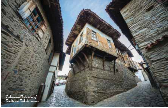
Geleneksel Türk evleri / Traditional Turkish houses

kahvehanesinde nar suyu ya da Türk Kahvesi yudumlayarak etrafı seyre dalmak çok keyifli. Aydınoğulları Beyliği zamanından kalma 752 yıllık Aydınoğlu Mehmet Bey Camii, tarihi kahvehanenin hemen karşısında. Caminin güney duvarındaki antik aslan heykeli, turkuaz ve morun en hoş tonlarıyla bezeli mihrabı ve sol ön köşesinde yer alan minaresi, onu farklı kılan özellikleri. Ancak onu asıl özel yapan 'kündekâri' yani 'ağaç geçki sanatı' tekniğiyle