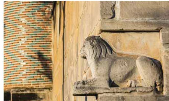
Aydınoğlu Mehmet Bey Camii'nin meşhur aslan heykeli / The famous lion statue of Aydınoğlu Mehmet Bey Mosque

Hatırı sayılır sayıda insan yalnızca türbeleri ziyaret etmek için her yıl yolunu Birgi'ye düşürüyor. Aslında bu gayet anlaşılır bir durum zira Birgi'nin tarih boyunca her zaman inançla, ruhsallıkla güçlü bir bağı olmuş. MÖ 7.