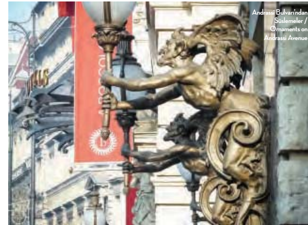
Andrássy Bulvarından Süslemeler / Ornaments on Andrássy Avenue