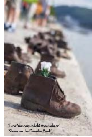
'Tuna Yürüyüşündeki Ayakkabılar' 'Shoes on the Danube Bank'