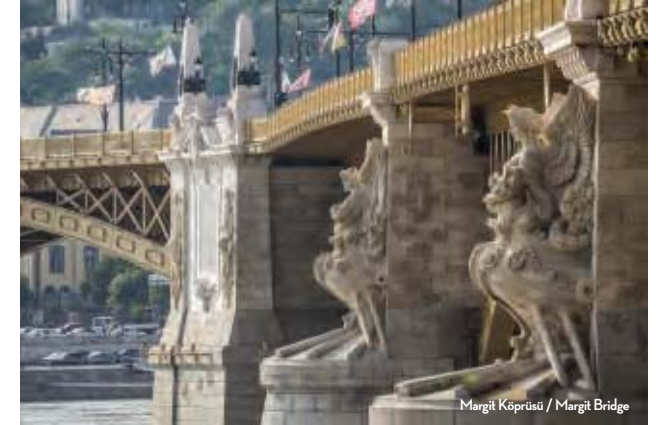
Margit Köprüsü / Margit Bridge

The pieces of art in this article are just