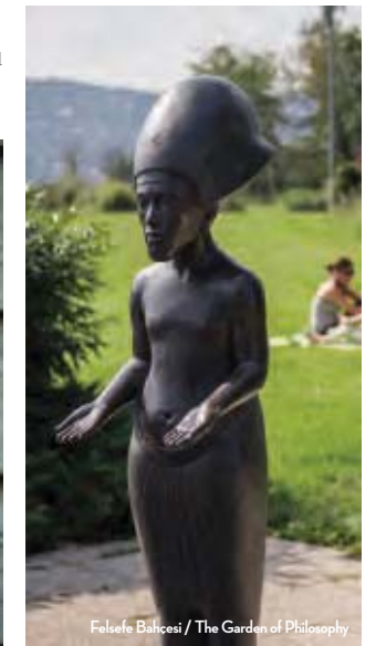
Felsefe Bahçesi / The Garden of Philosophy