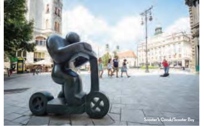
Scooter'lı Çocuk/Scooter Boy