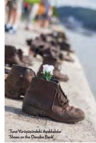
'Tuna Yürüyüşündeki Ayakkabılar' 'Shoes on the Danube Bank'