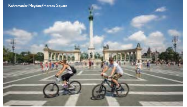
Kahramanlar Meydanı/Heroes' Square

If you have just arrived in the city you are certain to pass her by. She is always very busy, because there are many people who want to have their photo taken with her. Her name is Kiskirálylány, or Little Princess. This cute statue of a girl sitting on an iron railing is located at the tram stop near the Széchenyi Chain Bridge, the first bridge to link Buda and Pest. This statue was erected in 1989 and over the last 20 years has gained widespread fame