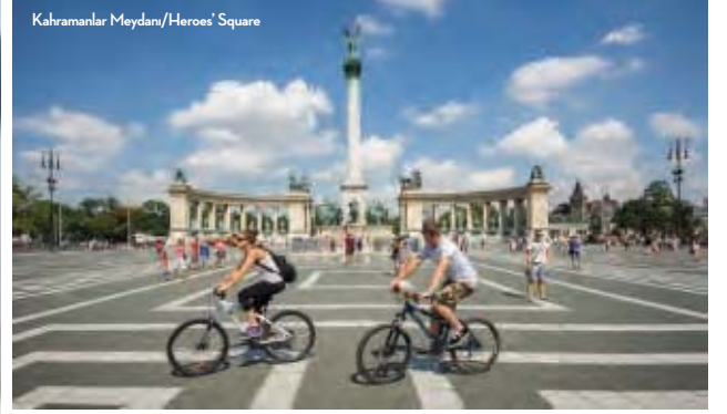
Kahramanlar Meydanı/Heroes' Square

If you have just arrived in the city you are certain to pass her by. She is always very busy, because there are many people who want to have their photo taken with her. Her name is Kiskirálylány, or Little Princess. This cute statue of a girl sitting on an iron railing is located at the tram stop near the Széchenyi Chain Bridge, the first bridge to link Buda and Pest. This statue was erected in 1989 and over the last 20 years has gained widespread fame