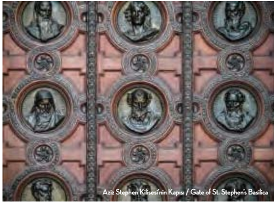
Aziz Stephen Kilisesi'nin Kapısı / Gate of St. Stephen's Basilica

sitting on the steps. This is a bronze statue of one of the country's best-loved 20th century poets, Attila József. Throughout his life and since his death, József has been acclaimed as one of the most important representatives of Hungarian poetry. In 1937, during one of the depressive periods that he suffered throughout his life, he threw himself under a train, taking his own life at the age of just 32. In his poems he examined subjects such as urban poverty and working class life, and the Hungarian poet's memory is now kept alive with this statue in one of the busiest areas of the city.