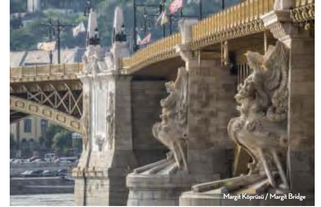
Margit Köprüsü / Margit Bridge

The pieces of art in this article are just