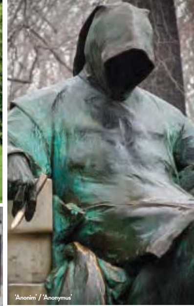
'Anonim' / 'Anonymus'

bulunan Gül Baba, Kanuni Sultan Süleyman'ın arkadaşı, aynı zamanda çok sevilen bir 16. yüzyıl Bektaşî dervişiymiş.