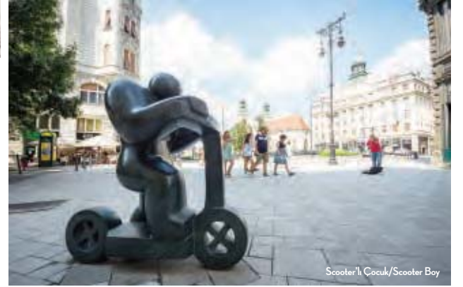
Scooter'lı Çocuk/Scooter Boy