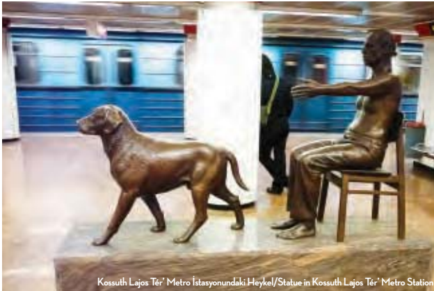
Kossuth Lajos Tér' Metro İstasyonundaki Heykel/Statue in Kossuth Lajos Tér' Metro Station