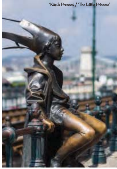
'Küçük Prenses' / 'The Little Princess'