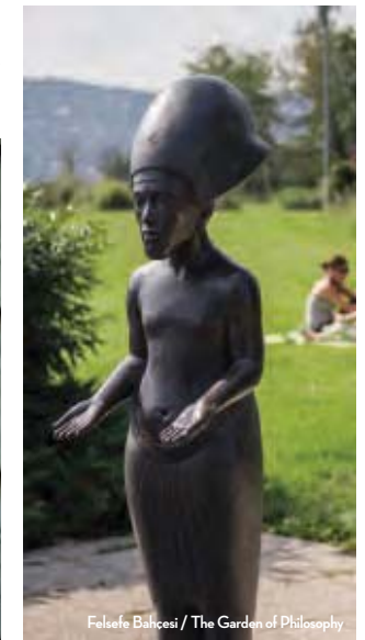
Felsefe Bahçesi / The Garden of Philosophy