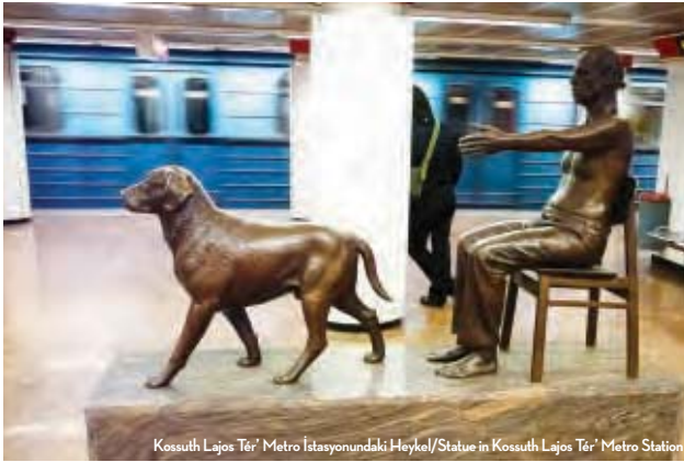
Kossuth Lajos Tér' Metro İstasyonundaki Heykel/Statue in Kossuth Lajos Tér' Metro Station