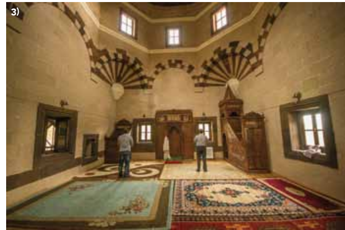
1) SARAY YAKINLARINDA BULUNAN AHMEDI HANI TÜRBESİ / AHMEDI HANI'S TOMB BY THE SIDE OF PALACE 2) SARAY YAKINLARINDAKİ ÖSMANLI DÖNEMİNDEN KALAN BİR MEZARLIK / A CEMETERY FROM THE OTTAMAN PERIOD BY THE SIDE OF PALACE 3) AHMEDI HANI CAMİİ / AHMEDI HANI MOSQUE

öncesine dair hülyalara sürüklüyor. Selçuklu mimari geleneklerinin klasik bir örneği olan kümbet şeklinde inşa edilmiş sekizgen türbede Çolak Abdi Paşa, İshak Paşa ve yakınları yatıyor. Taş ocaklı odalardan birinin penceresinden aşağı doğru bakmak yüreğinizi ağzınıza getirmeye yetiyor. Zira İshakpaşa'nın kuzey, batı ve güney cepheleri, vadiye dik ve meyilli olduğundan sanki uçurumun kenarındaymışınız izlenimi veriyor. Ayaklarınızın altında, güneş yer değiştirdikçe kırmızının çeşitli tonlarına bürünen Doğubayazıt... M.Ö. 800'lü yıllarda Urartular zamanında kurulduğu tahmin edilen Eski Bayazıt'tan kalan bir cami, mezar ve kale burcu