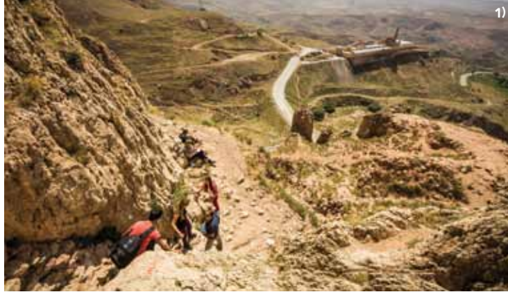
1) URARTU KALESİ'NE ÇIKAN DİK VE ZAHMETLİ YOLLAR / ARDUOUS ROADS CLIMBING TO THE URARTU CASTLE 2) GÖRKEMLİ AĞRI DAĞI / MAGNIFICENT MOUNT AĞRI 3) DOĞUBAYAZIT'A YAKIN KÖYLERDE YOL KENARINDA KARŞINIZA ÇIKAN SEBZE SATICILARI / A VEGETABLE SELLER FROM A SURROUNDING VILLAGE TO DOĞUBAYAZIT ON THE ROADSIDES