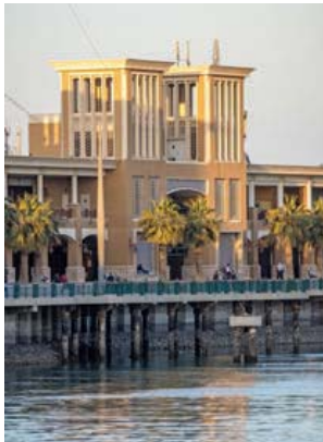
‘Sharq’ Alışveriş Merkezi’nin dekoratif rüzgar kuleleri.