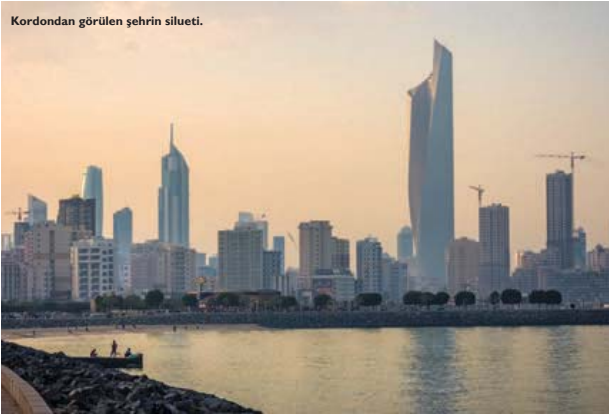
Kordondan görülen şehrin silüeti.

aynalı yıldız, kuş ve kelebek figürleriyle süslü evinin kapısını açtı ve beni ancak yüzde 1'ini tahmin edebileceğim bir masala doğru sürükledi.