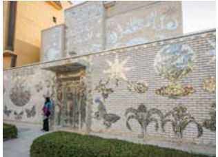
Aynalar evinin dışı da tıpkı içi gibi aynadan motiflerle süslü.

Onu nasıl anlatmalı? 77 yaşındaki çilgin sanatçı. 2003 yılında vefat etmiş, ülkenin öndegelen ressamlarından Khalifa al-Qattan'ın biricik aşkı, 45 yıllık karısı. Bir gecede ülkesini terk edip İngiltere'ye yerleşmeye karar veren cesur İtalyan. Kuveyt'teki en büyük yapının derme çatma kerpiç evler olduğu 1959 yılında, sevgilisi uğruna daha önceden adını bile duymadığı bu çöl ülkesine gelen gözüpek aşık. 2008 yılından beri Kuveyt turizmüne hatırı sayılır katkısı bulunan 'Aynalar Evi'ne varmadan önce Lidia hakkında duydukların bunları. Beklenti yüksek olunca, tatmin olmak zordur. Ama hayır, bu sefer öyle olmadı. Zira Lidia,