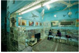
Lidia, ziyarete başlamadan önce, konuklarına kendi yaptığı içecek ve yiyecekleri ikram ediyor.

tanınan bir sanatçıya dönmüş Lidia al-Qattan'ın ta kendisi.