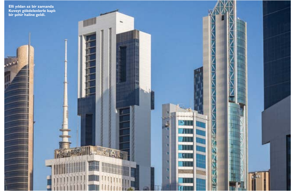
Elli yıldan az bir zamanda Kuveyt, gökdelenlerle kaplı bir şehir haline geldi.

Lidia da ortaya çıkan -ve hayatının kalanına yön verecek- eseri çok beğenmiş. "Sonra kendi kendime dedim ki, neden salonun bir duvarını mozaik aynalarla kaplamayayım? Bir duvar, sonra bir diğeri derken fikir gittikçe büyüdü ve sevgili eşimin vasiyetiyle