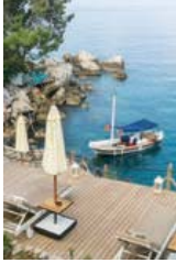
Perdue 8, Nautical 12 dönüm üzerine kurulu. İki işletmedeki toplam personel sayısı 50.