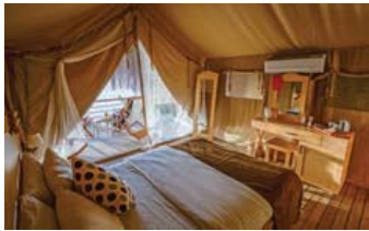
Perdue'nin çadır odaları her türlü ihtiyacınız düşünülerek tasarlanmıştır.

kendimi, Perdue'nin zigzaglar halinde denize inen merdivenlerinden inerken de en mavi okyanusların, en kıvrak deniz kızlarının hikayesine tanık oluyor gibiyim.