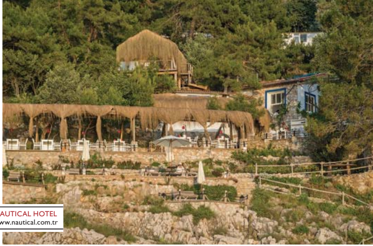
NAUTICAL HOTEL www.nautical.com.tr

inçe tasarımın, konforun ve lüksün taşınmış olması.