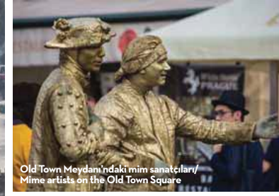
Old Town Meydanı'ndaki mim sanatçıları/ Mime artists on the Old Town Square

yaşadı. Hayatına girmiş önemli kadınlardan Felice'le bu meydana nişanlandı. Nazi kamplarına gönderilen kız kardeşlerinden biriyle beraber son kez fotoğraf çektikleri anın tek ve biricik şahidi yine bu meydana... Kafka'nın adını döndürüp dolaşırken yine eski kent meydanına çıktığından, büyük yazarın anlamak için meydana daha dikkatli bakın. Yazarın, penceresine