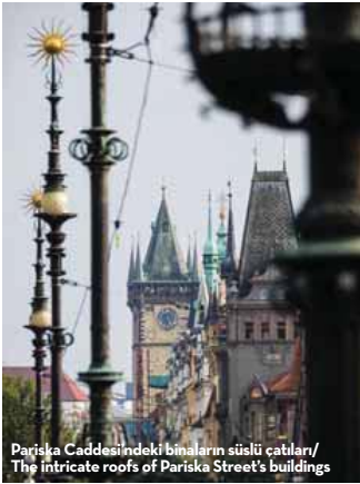
Pariska Caddesindeki binaların süslü çatıları/ The intricate roofs of Pariska Street's buildings