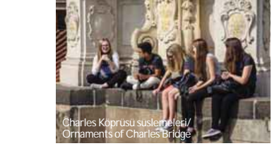
Charles Köprüsü süslemeleri/ Ornaments of Charles Bridge