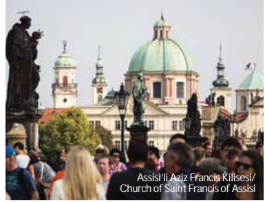
Assisi'li Aziz Francis Kilisesi/ Church of Saint Francis of Assisi