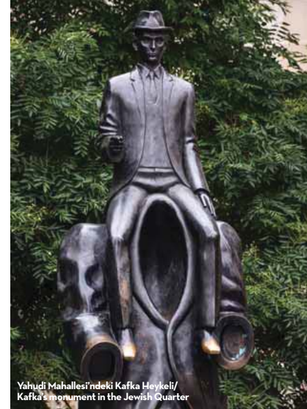
Yahudi Mahallesi'ndeki Kafka Heykeli/ Kafka's monument in the Jewish Quarter

THE HOTEL WHERE HE READ 'THE TRIAL' During Kafka's lifetime the Grand Hotel Europa at number 25 Václavské Street was known as the Erzherzog Stephan Hotel, and Kafka gave one of his first public readings in this building on 4 December 1912. In 'The Trial', the story that he shared that day, he wrote of the oppression he felt from the overwhelming power of his father. Just opposite the Hotel Grand Europa stands Lucerna, where Kafka and his friends would visit often to watch films and cabaret shows.