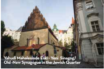
Yahudi Mahalesinde Eski - Yeni Sinagog/ Old - New Synagogue in the Jewish Quarter