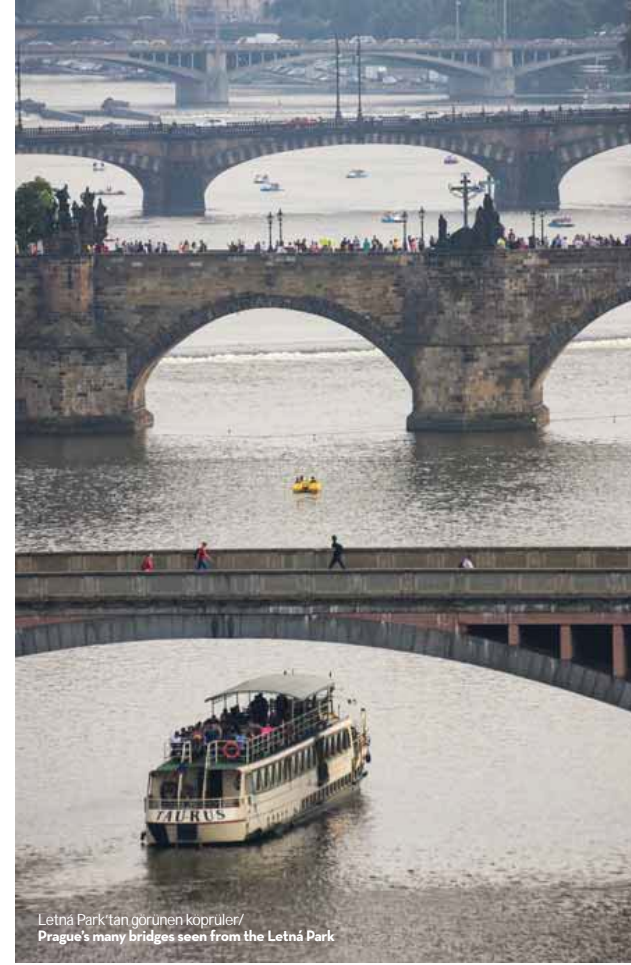
Letná Park'tan görünen köprüler/ Prague's many bridges seen from the Letná Park