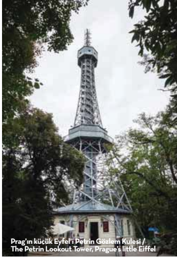
Prag'ın küçük Eiffel'i Petrin Gözlem Kulesi / The Petrin Lookout Tower, Prague's little Eiffel