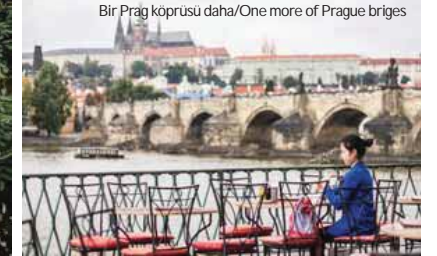
Bir Prag köprüsü daha/One more of Prague bridges

olarak bilinen Felice Bauer, aşkını çok sayıda mektupta anlattığı ve ilişkileri mektuplaşmalarla süren Milena Jesenka ve son sevgilisi olarak bilinen Dora Diamant'ın cemeân içindeki fotoğrafları, gerçekten de oradalarmış izlenimi veriyor. Müzeyi gezdiğinizde, otoriter, eleştirel ve koca cüsseli babasının altında kendini ezilmiş hissedene, onunla ilgili olarak yaşadığı duyguyu yoğunluğunu ancak yazdığı eserlerde dile getirebilmiş, ince ve zarif bir bedene sahip Franz Kafka ile çok daha fazla empati kurmanız mümkün.