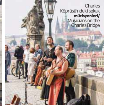
Charles Köprüsü'ndeki sokak müzisyenleri/ Musicians on the Charles Bridge