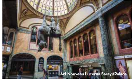
Art Nouveau Lucerna Sarayı/Palace