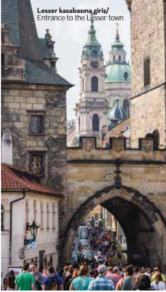
Lesser kasabasına giris/ Entrance to the Lesser town

A vrupa'nın göbeğinde, kasvet, sis ve belirsizlik dolu bir şehir... Nereden geldiğini kestiremediğiniz bir huzursuzluk, rahatsızlık asılı havada... Meydanlarında, sokaklarında, köprülerinde dolaşırken içinizde yeşeren duygunun tarifi zor. Zira bir yandan puslu yüzüyle kendinden soğutur bu şehir sizi, bir yandansa ondan bir türlü ayrılmazsınız gelmez. Uzaklaşıp bir daha yüzünü görmemek için can attığımız, ancak bir türlü elini bırakmadığımız karanlık bir sevgili gibidir Prag. Tam ürkek ve narin ellerinden sıyrılıp "Elveda" dediğiniz vakit kendinizi tutamayıp içinizi ısıtan kollarına atılırsınız yeniden. Bu gelgitli duygunun çözümsüzlüğüyle Prag'dan bir türlü kopamazsınız.