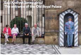
Eski Belediye Binası/ Old Town Hall