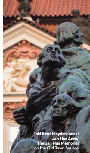
Eski Kent Meydanı'ndaki Jan Hus Anıtı/ The Jan Hus Memorial on the Old Town Square